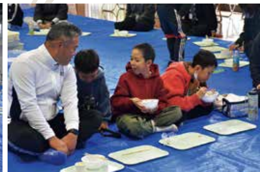
おいしいそばで、みんなが笑顔に