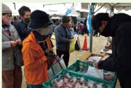
大人気の五島ルビートマト