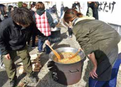
出汁作りに勤しむ青年部と保護者ら

今年も会場にはたくさんの笑顔が広がり、地域と子どもたち、そしてJ A青年部と一緒に作る賑やかでやさしい時間となりました。