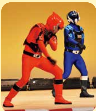
ゴーライザーショー