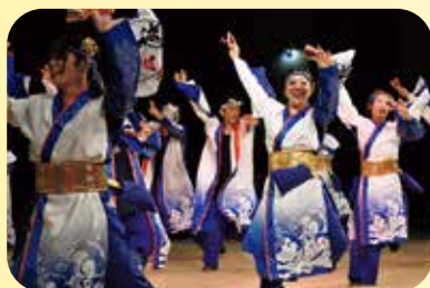
上五島よさこい連『夢波涛』