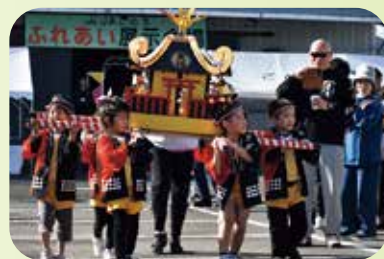
文化保育園の演技