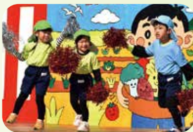
幼徳保育園の演技