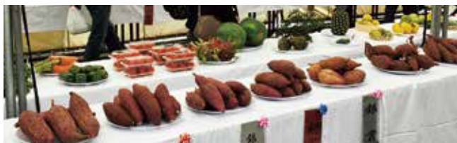
下地区農産物コンクール