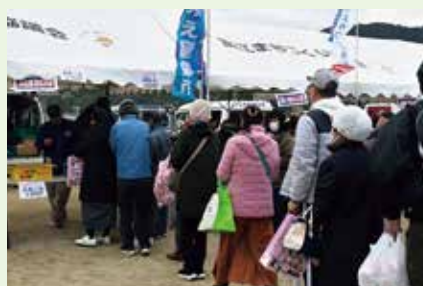
テント前には長い列ができました