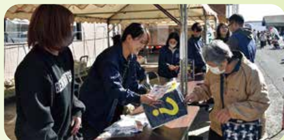
ポイントラリー抽選