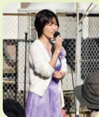
五島つばき歌謡ショー