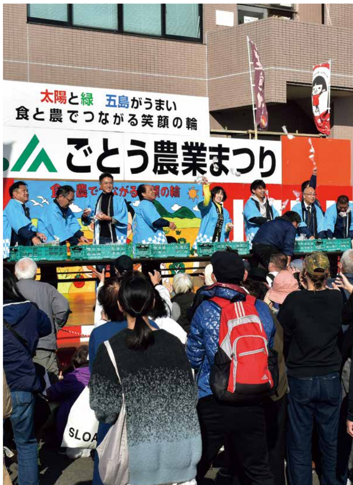
農業まつり(下地区) 餅まき

農産物・お弁当コンクール ブロンズコーの匂、到来！ 令和7年の高価格販売者を表彰 JAごとう農業まつり ブロンズコー部会 出荷会議 肉用牛生産振興大会