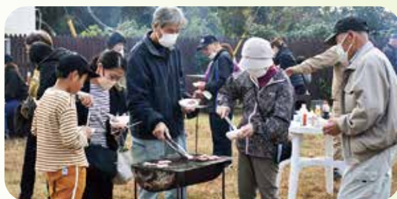
五島美豚&経産肥育牛 大試食会