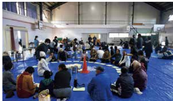
できたてそばを待つ来場者