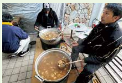
大量のおでんも完売となりました