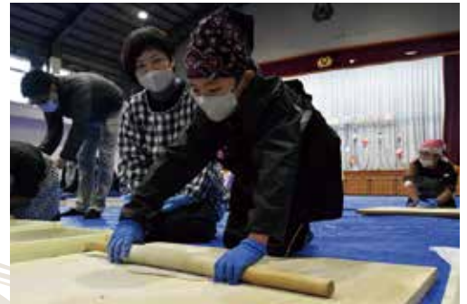
まるで職人のように生地を伸ばす児童

12月4日、富江地区の盈進小学校で、子どもたちが心待ちにしていた「盈進祭り」が開かれました。