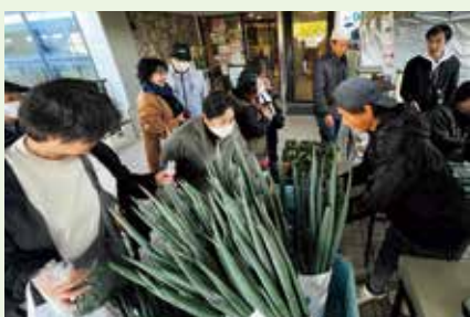
生産者の気合いが光る600本もの深ネギ