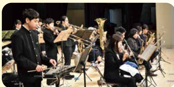
上五島ウィンドオーケストラ(中学生吹奏楽部)