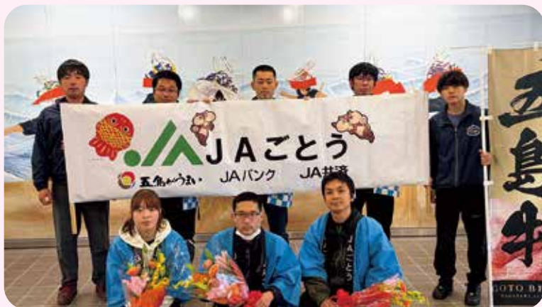
出演後には出演者全員で記念撮影。 音楽を通じて地域と心を通わせる素敵な時間でした。