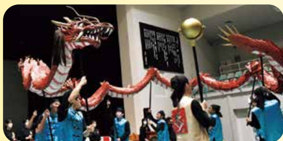
新上五島在宅ケアセンターによる龍踊

会場を華やかに彩ったのは、迫力満点の「龍踊」や、子どもたちが元気いっぱいのダンスを披露した「ちびっこエアロ」。一瞬で面が変わる不思議な「変面ショー」には大人も子どもも釘付けに。フィナーレの餅まきでは会場中に歓声が響き渡り、地域の伝統と若き活力が融合した、活気あふれる冬の一日となりました。