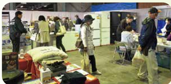
電化製品大展示会