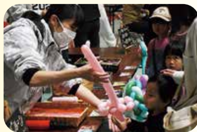
バルーンアートプレゼント