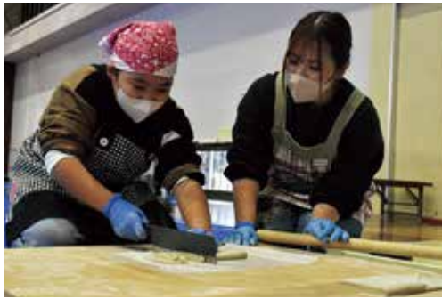
真剣な表情でそば切りに挑戦