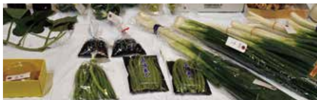
上地区農産物コンクール