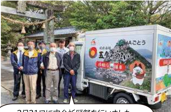
3月31日に安全祈願祭を行いました。 安全運転に努めます！

四月一日より下地区に続いて上地区でも移動店舗車を運行します。三月末でAコープ有川・上郷・北魚目店が閉店。今後は地域への貢献とサービス低下を補う対応として移動店舗車二台が運行します。荷台には購買スペースが設けられており、食糧品や日用品を販売しています。