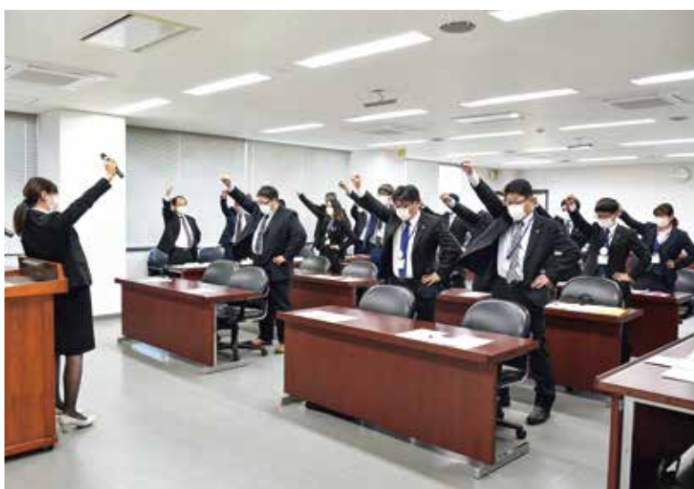
出席者全員でのガンバロー三唱

十一月九日。本店にてLA下期対策会議を開催し、LAの二年連続目標達成に向け、士気を高めました。 会ではLAリーダーによる取り組み発表や、各担当地区の目標達成に向けた意思表明がありました。またLA職員からの体験発表が行われ、最後に、下期に向けて出席者全員によるガンバロー三唱で締めくくられました。