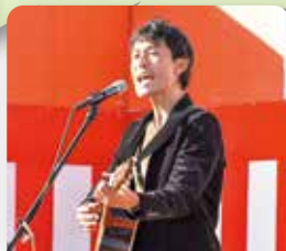
江頭つとむミニライブ