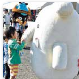
子供に大人気 ゆるキャラ