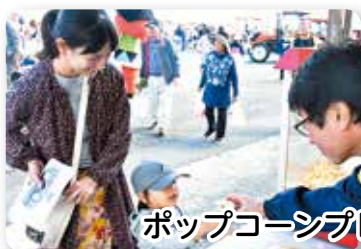
ポップコーンプレゼント