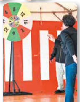
輪投げ&ルーレット