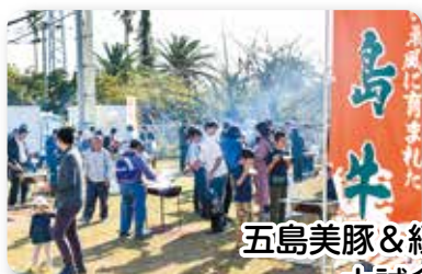
五島美豚 & 経産肥育牛 犬試食会