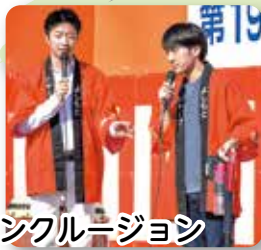
インクルージョン による電化製品紹介