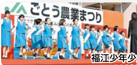
福江少年少女合唱団