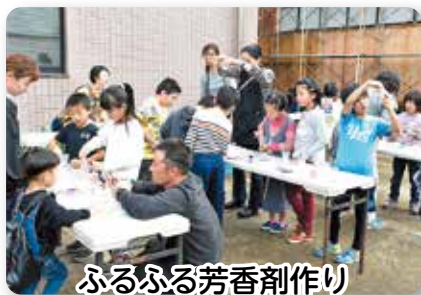
ふるふる芳香剤作り (フレミズ部会)