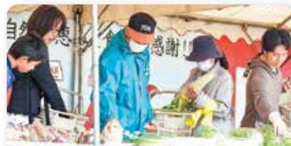
「みんなの良い食」目方でドン!