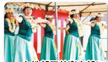
女性部三井楽支部による フラダンス