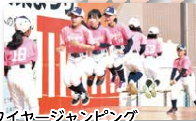
ロングワイヤージャンピング