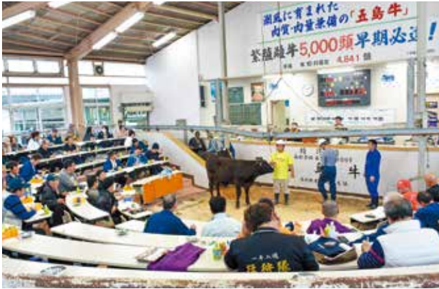
令和元年度11月期せり市成績表（子牛）

十一月十三日、十四日の両日、五島家畜市場で令和元年十一月期せり市を開きました。子牛の平均価格は七三万八二六五円（前回比二・一％安）となりました。市場には家畜農家一八二戸が子牛五六一頭、成牛五八頭を上場（売却六一九頭）。子牛の最高価格は一五〇万二六〇〇円、成牛の最高価格は七八万一〇〇〇円となりました。 畜産担当者は「今回の雌は導入の引き合いが強く、前回並みで推移し、去勢は四・四パーセント下がった。依然として出荷牛のバラつきが散見されるので農家には子牛の適正な飼養管理に努めてほしい」と話しました。